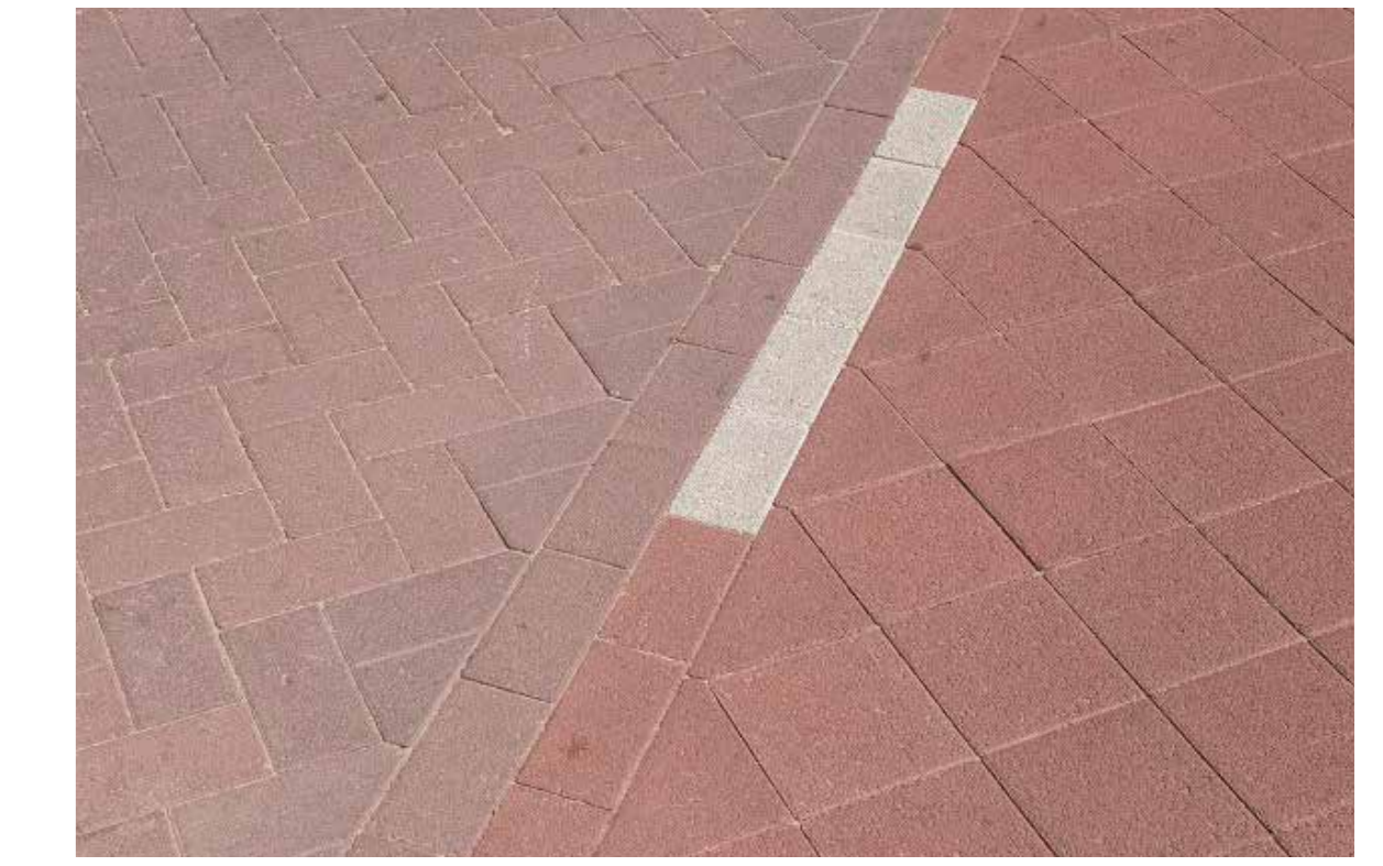
Afwijkende fiets accent-strook t.o.v. rijbaan