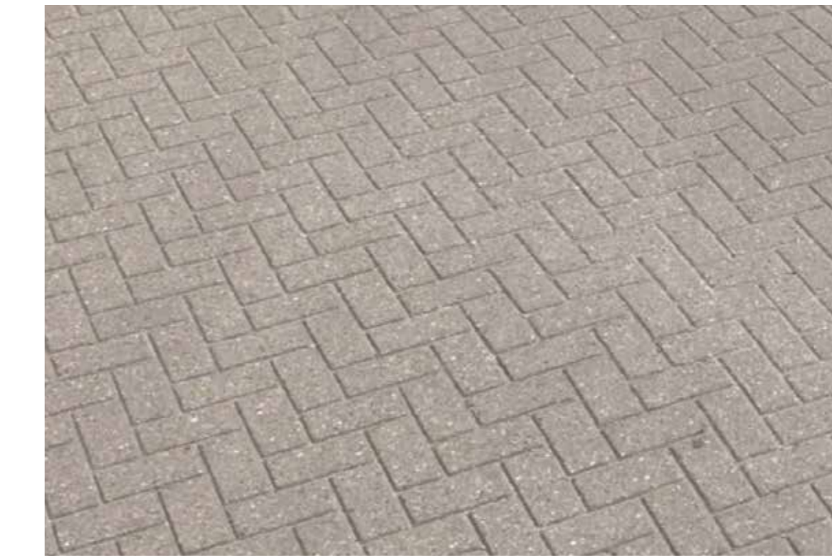
Betonstraatsteen conform Udenhoutseweg